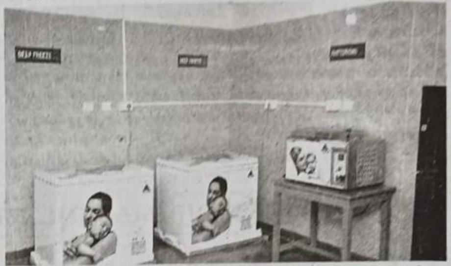
ஜிப்மரில் இயங்கி வரும் அமுதம் தாய்ப்பால் வங்கி.

தட்பவெப்ப நிலையில் பதப்படுத்தி வைத்து, பிறகு சுத்திகரிப்பு செய்து கிருமித் தாக்கம் உள்ளதா என மீண் டும் பரிசோதித்து, அதன் பிறகே தேவைப்படும் பச் சிளம் குழந்தைக்கு தாய்ப் பால் கொடுக்கப்படுகிறது.