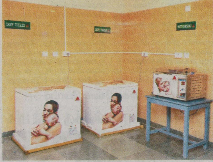
▶ ஜிப்மரில் இயங்கி வரும் தாய்ப்பால் வங்கி.

கடந்த 9 ஆண்டுகளாக இந்த தாய்ப்பால் வங்கி மூலம் பச்சிளம் குழந்தைகள் பலர் பயனடைந்துள்ளார்கள். இந்த தாய்ப்பால் வங்கி, ஜிப்மர் மகளிர் மற்றும் குழந்தைகள் மருத்துவமனையின் முதல் தளத்தில் பச்சிளம் குழந்தைகள் தீவிர சிகிச்சை பிரிவுக்கு அருகிலேயே செயல்பட்டு வருகிறது. அதிக பிரசவங்கள் நடைபெறும் மருத்துவமனைகளில் தாய்ப்பால் வங்கியின் சேவை அளப்பரியது. தாய்மார்களால் சில காரணங்களால் குழந்தைக்கு பால் கொடுக்க முடியாதபோது, தானமாக பெறப்பட்ட தாய்ப்பால் உதவுகிறது. கொரோனா காலத்தில் கூட, தாய்ப்பால் வங்கி மிகவும் பயனுள்ளதாக இருந்தது. தாய்ப்பால் வங்கி ஆரம்பித்தபோது, ஒரு நாளைக்கு 400 மில்லி தாய்ப்பால் சேகரிக்கப்பட்டது. தற்பொழுது, ஒரு நாளைக்கு 1,000 மில்லி வரை சேகரிக்கப்படுகிறது. தினமும் குறைந்தபட்சம் 20 குழந்தைகள் குறிப்பாக குறைமாத குழந்தைகள் இந்த தாய்ப்பால் வங்கியிலிருந்து அதிகம் பயன்பெறுகிறார்கள். தாய்ப்பால்