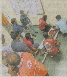
A batch of first responders undergoing training as part of an ICMR programme.